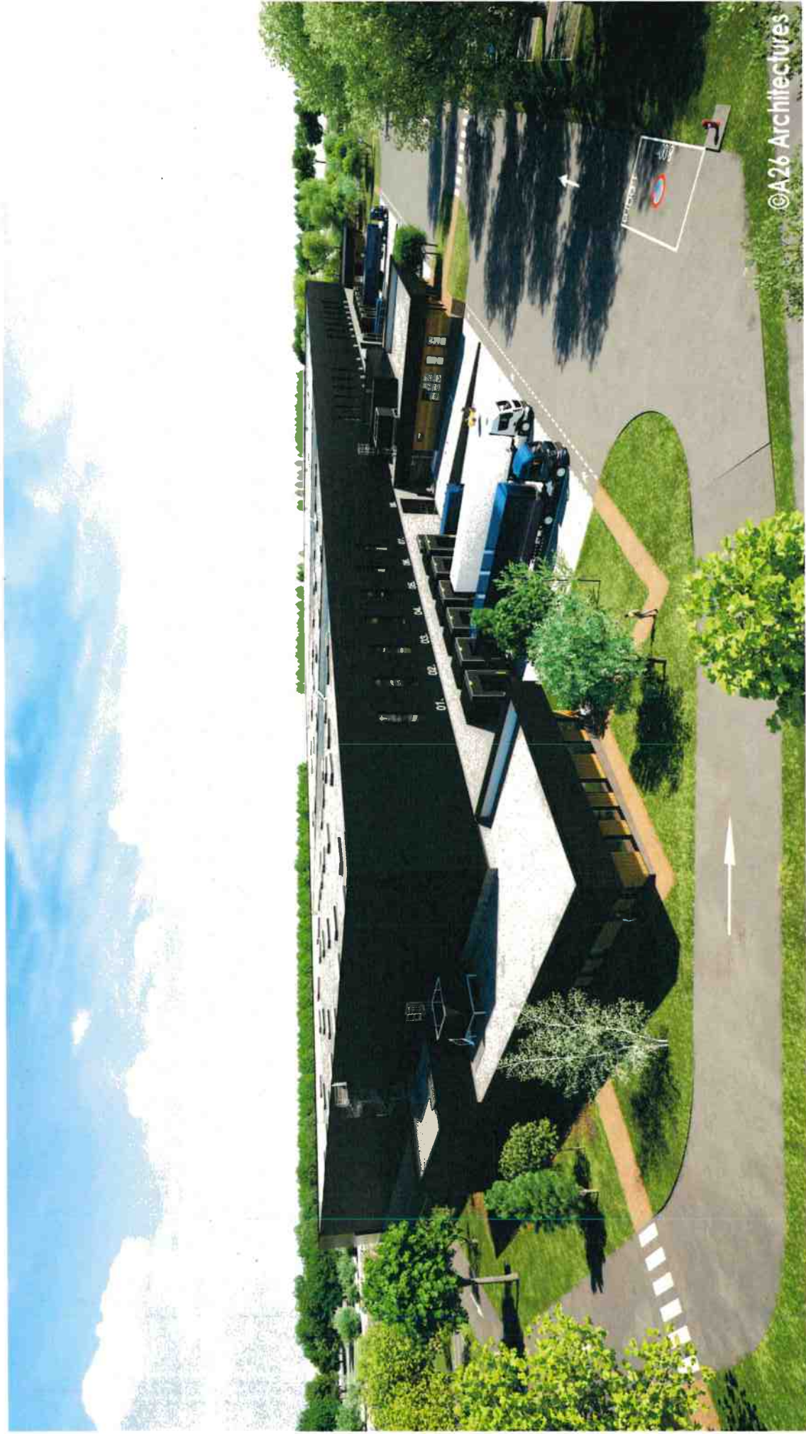
PC6-04 Vue plot bureau large